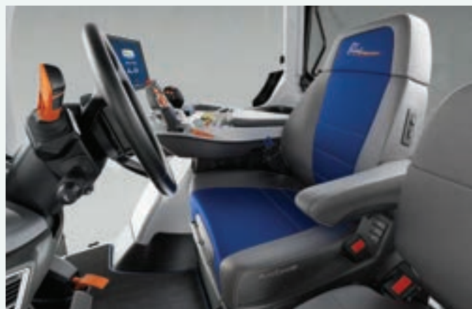
Série T7 à empattement long