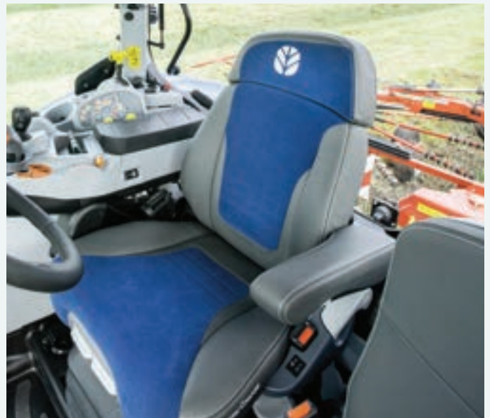
Siège Dynamic Comfort MC