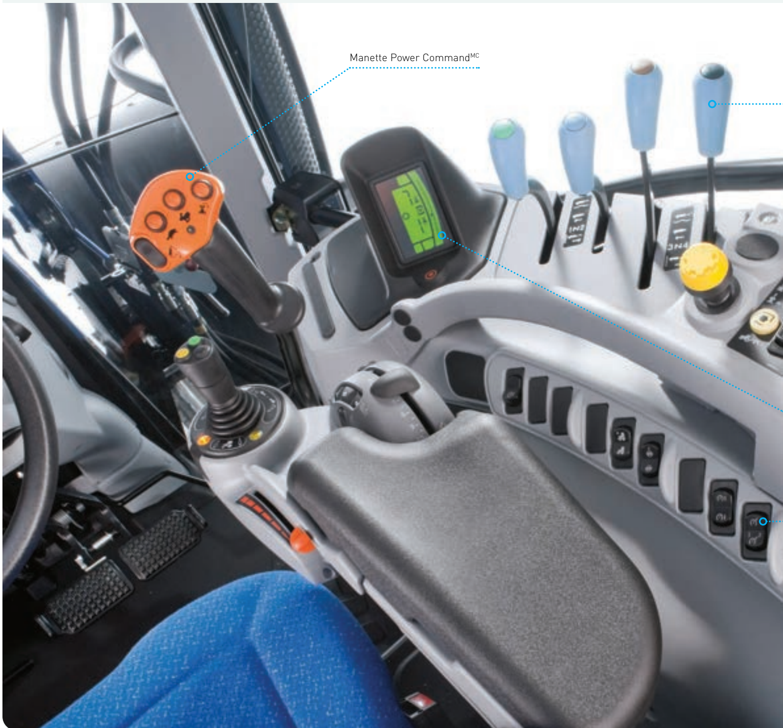
Manette Power Command MC

Comme les modèles SideWinder MC à empattement standard de série T7, les modèles classiques à empattement long sont dotés de contacteurs et de commandes positionnés de manière logique et ergonomique qui sont faciles à utiliser.