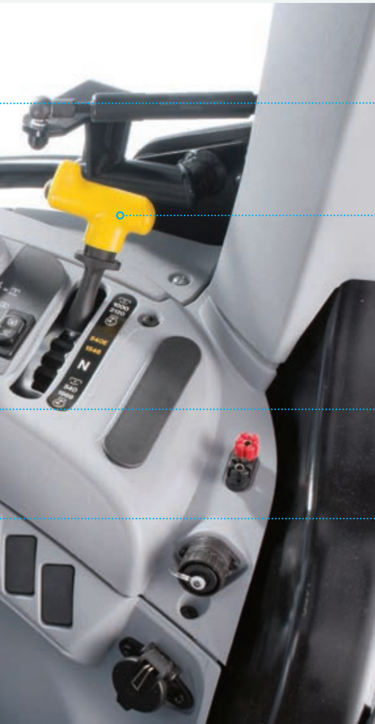
Leviers mécaniques à distance

De plus, l'affichage numérique simple vous permet d'identifier les fonctions principales du tracteur, de sorte à toujours garder le contrôle de votre tracteur et des tâches à exécuter.