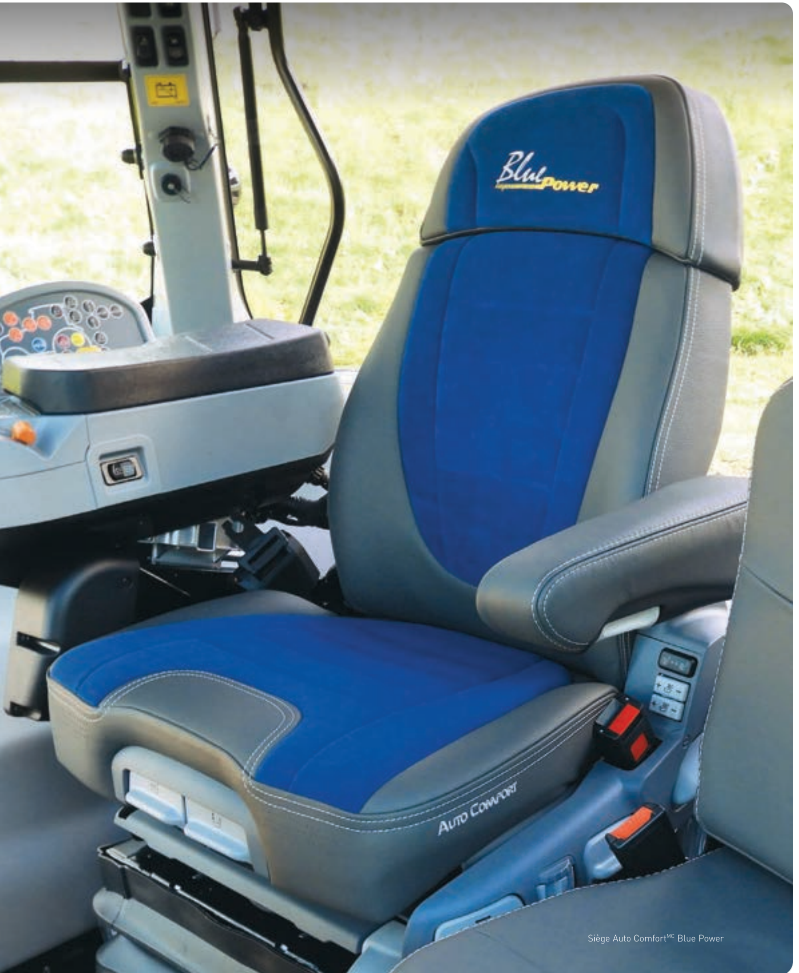
Siège Auto Comfort MC Blue Power